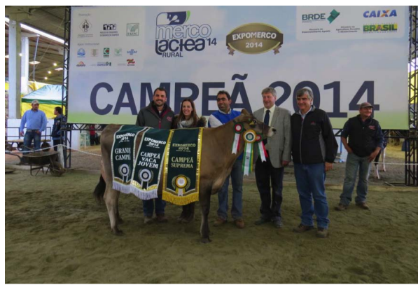
Grande Campeã e Suprema das Raças Chapecó