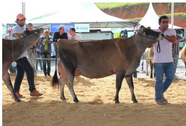
Campeã Vaca 2 Anos Sênior Xanxerê, Reservada Campeã Vaca Jovem da Exposição