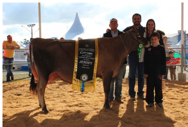
Campeã Vaca Jovem em Itajaí, Reservada de Grande Campeã da Exposição

Abaixo algumas fotos para nossa recordação dela nas pistas de 2014!