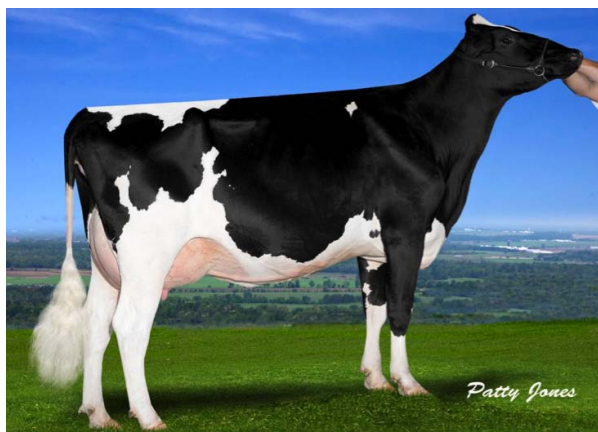
MS CHASSITY SUPER CHARLEEN (SUPER x CHASSITY EX 92 x BARBIE EX), foi recém classificada no segundo parto MB 86 Pontos no Canadá com 51,60 Kgs de leite, 3,50% Gordura, 2,90% Proteína, 13 CCS e com projeção de 13.171 kgs de leite em 305 dias.

Sendo assim apresentamos nossas novidades deste início de 2015! Aproveitando para desejar um ótimo ano com muitas bezerras, saúde e realizações!!