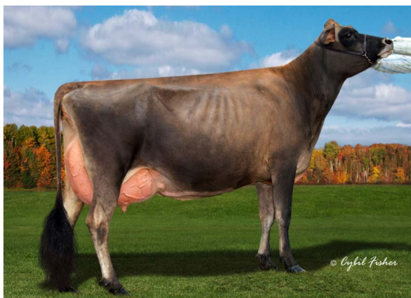
RATLIFF MINISTER RUTHIE EX 91 - 2E - classificada novamente no 4º. Parto com projeção de 9.042Kgs de leite - 6,50% de gordura - 4,40% Proteína, vaca oriunda de uma grande família da raça Jersey tanto em produção como nas pistas da America do Norte.